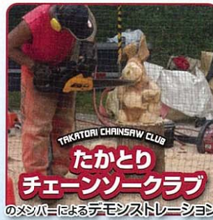
たかとりチェーンソークラブのメンバーによるデモンストレーション